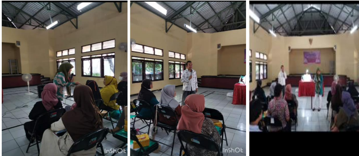
GAMBAR 3. KEGIATAN SOSIALISASI DAN PELATIHAN

Kegiatan pendampingan dilakukan dengan mendampingi khalayak sasaran dengan sosialisasi terlebih dahulu pentingnya legalitas usaha Hak Kekayaan Intelektual merek. Kegiatan pendampingan ini berfokus pada nilai edukasi praktis pentingnya legalitas usaha merek dan pengenalan sistem di DJKI.