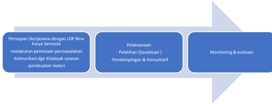
GAMBAR 1. METODE KEGIATAN PENGABDIAN MASYARAKAT

Kegiatan pengabdian yang dilakukan sebagai berikut :