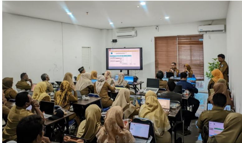
Gambar 1. Sosialisasi Pedoman Penyusunan APBD Th. 2026 dengan Aplikasi SIPD-RI