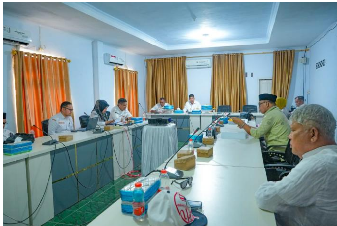
Gambar 2. Koordinasi Jadwal Penganggaran