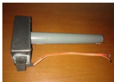
Gambar 2.2 Sensor Salinitas

Sensor Salinitas adalah suatu sensor yang dapat mengukur kadar kadar garam dalam suatu kandungan zat yang terlarut pada air. Untuk perancangan sensor salinitas, dapat menggunakan prinsip konduktivitas yang ada pada dua probe dan di letakan pada suatu larutan yang diberikan beda potensial listrik (pada normalnya membentuk suatu sinusioda). Sebuah sistem konduktivitas tersusun atas dua elektrode yang dirangkaikan dengan sumber tegangan serta sebuah ampere meter. Eletrode-elektrode tersebut diatur sehingga memiliki jarak tertentu antara keduanya ( biasanya 1 cm). Pada saat pengukuran, kedua elektrode ini di celupkan ke dalam sampel larutan dan diberi tegangan dengan besar tertentu. Nilai arus listrik dibaca oleh ampere meter, digunakan lebih lanjut untuk menghitung nilai konduktivitas listrik larutan.