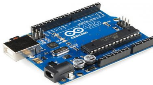
Gambar 1. Arduino Uno [5]

Arduino Uno adalah sebuah board mikrokontroler yang didasarkan pada Atmega328. Arduino Uno mempunyai 14 Input/output dengan 6 input PWM, 6 input analog, sebuah osilator kristal 16 Mhz, sebuah koneksi USB, sebuah power jack , sebuah ICSP header, dan sebuah tombol reset. Arduino Uno memuat semua yang dibutuhkan untuk menunjang mikrokontroler, mudah menghubungkan ke sebuah komputer dengan sebuah kabel USB dengan sebuah adaptor AC ke DC atau menggunakan baterai untuk memulainya.