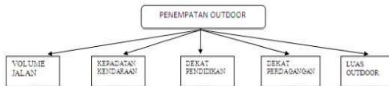
Gambar 3. Kriteria Penempatan Media

Setelah diketahui kriteria dan alternatif yang akan digunakan dalam menentukan prioritas penempatan informasi promosi penerimaan mahasiswa baru promosi, terdapat kriterianya seperti volume jalan, kepadatan kendaraan, dekat pendidikan, dekat perdagangan, luas media maka dibuat susunan hirarki permasalahan untuk menggambarkan cara mencari solusi penentuan penempatan promosi seperti ditunjukkan pada Gambar 3 berikut ini.